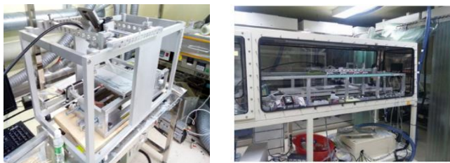
圖三：(左)本團隊自行研發之30公分行程刮刀機台 (右)120公分行程機台組裝中