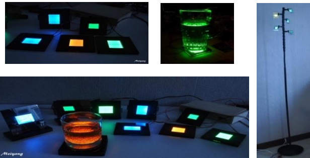
圖四：本團隊製作之低成本OLED 裝飾性照明